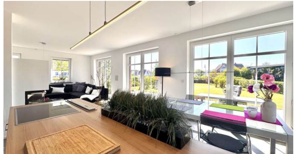
Küche + Esstisch