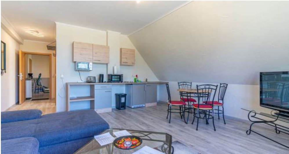
Fewo 3 - Wohnzimmer