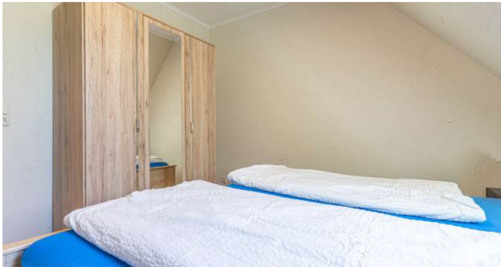
Fewo 3 - Schlafzimmer