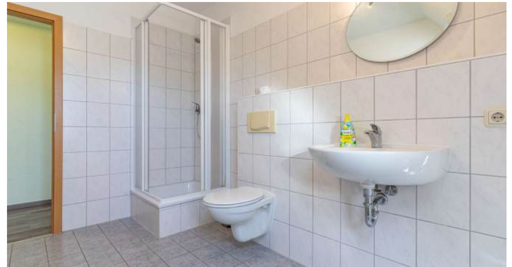
Fewo 4 - Bad