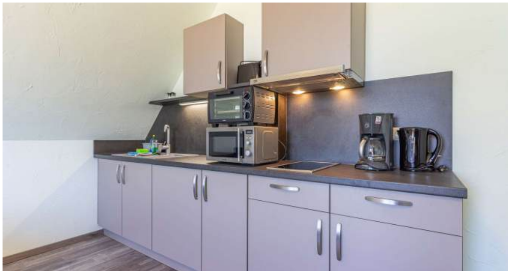
Fewo 3 - Küche