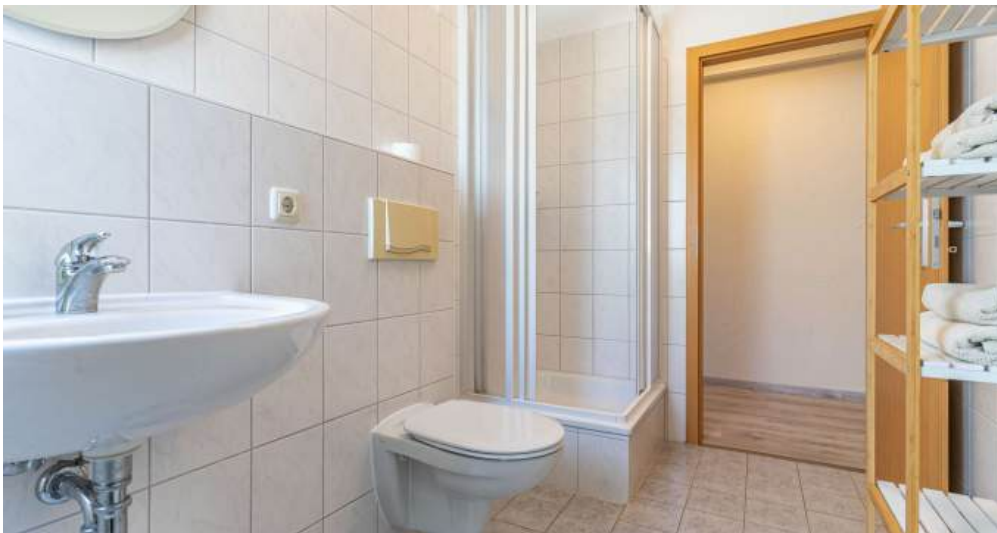
Fewo 3 - Bad