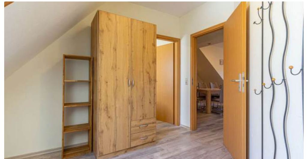
Fewo 5 - Schlafzimmer