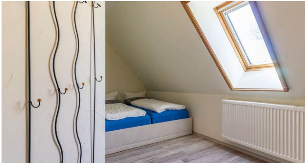
Fewo 5 - Schlafzimmer