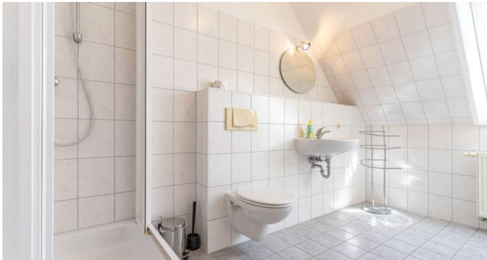
Fewo 4 - Bad