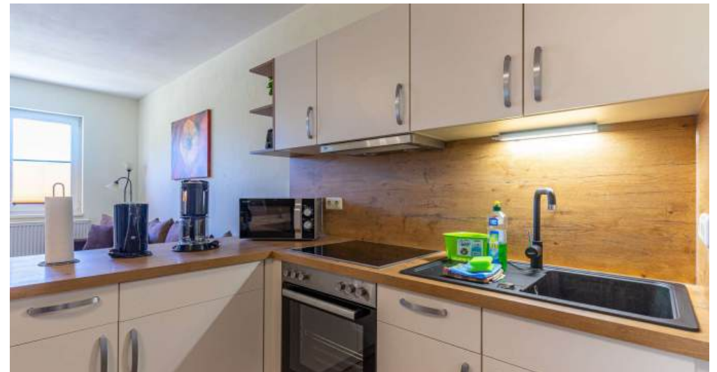
Fewo 5 - Küche