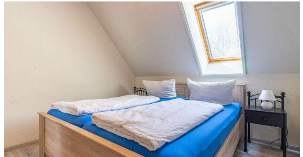
Fewo 3 - Schlafzimmer