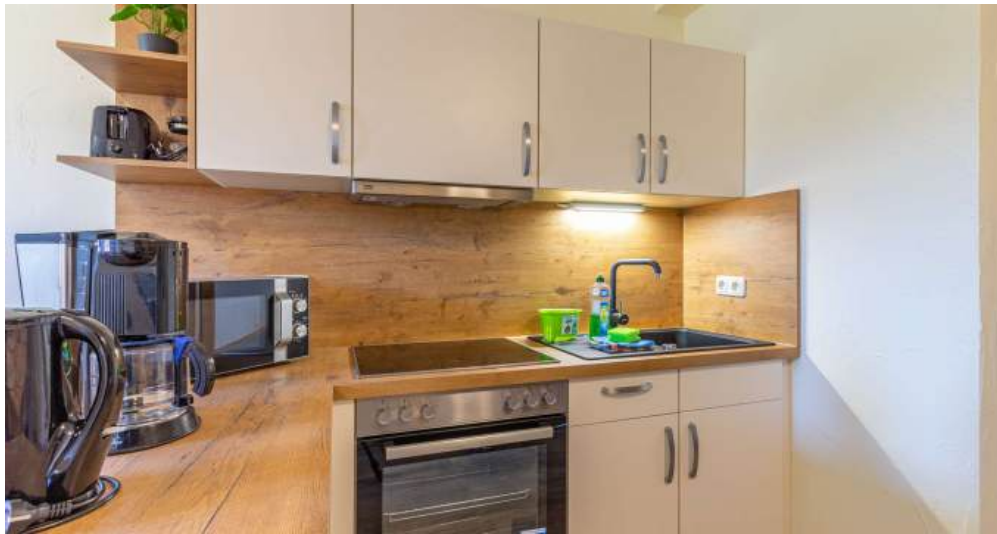
Fewo 5 - Küche