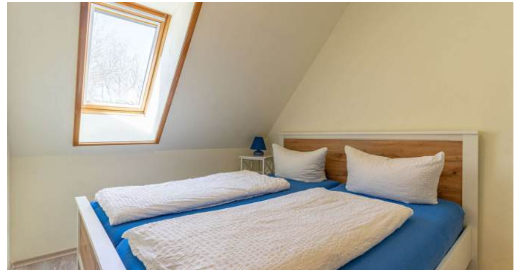
Fewo 5 - Schlafzimmer