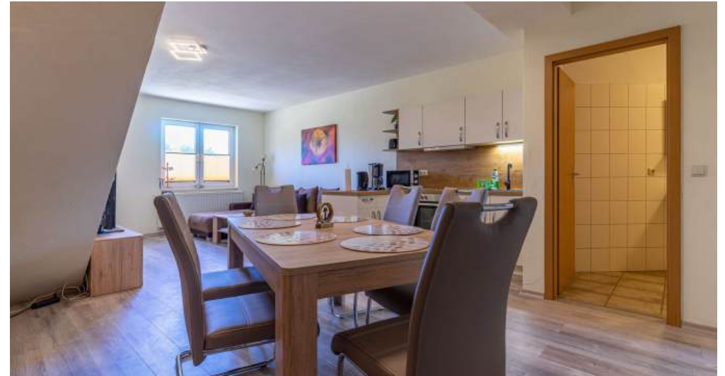
Fewo 5 - Küche