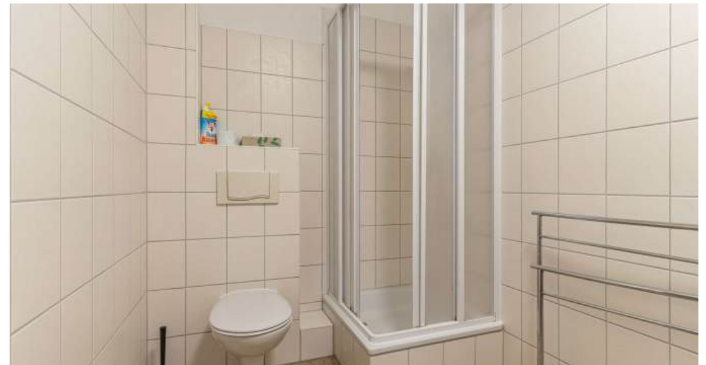
Fewo 5 - Bad