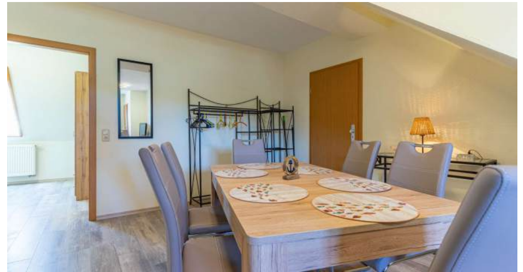
Fewo 5 - Küche