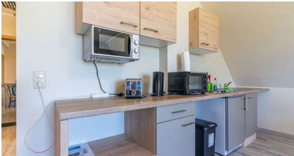
Fewo 3 - Küche