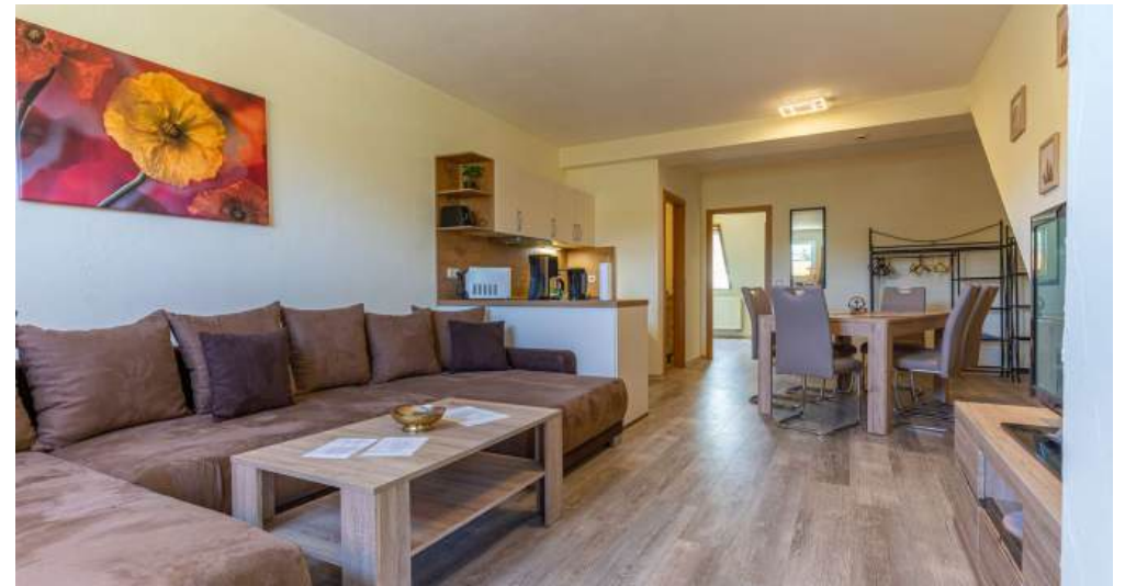
Ferienwohnung 5 -Wohnzimmer