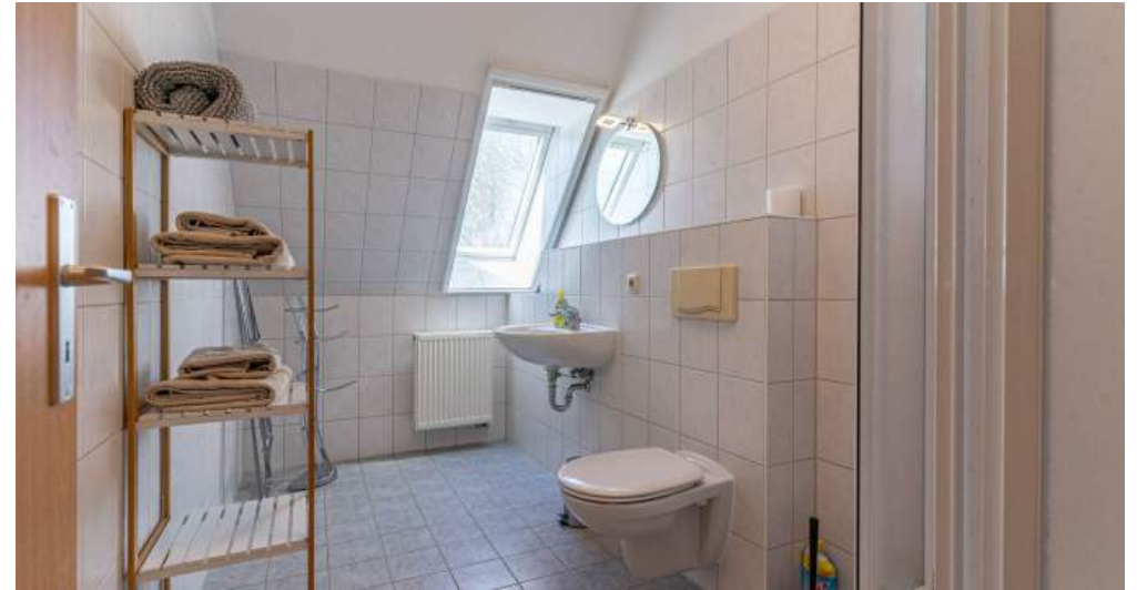
Fewo 3 - Bad