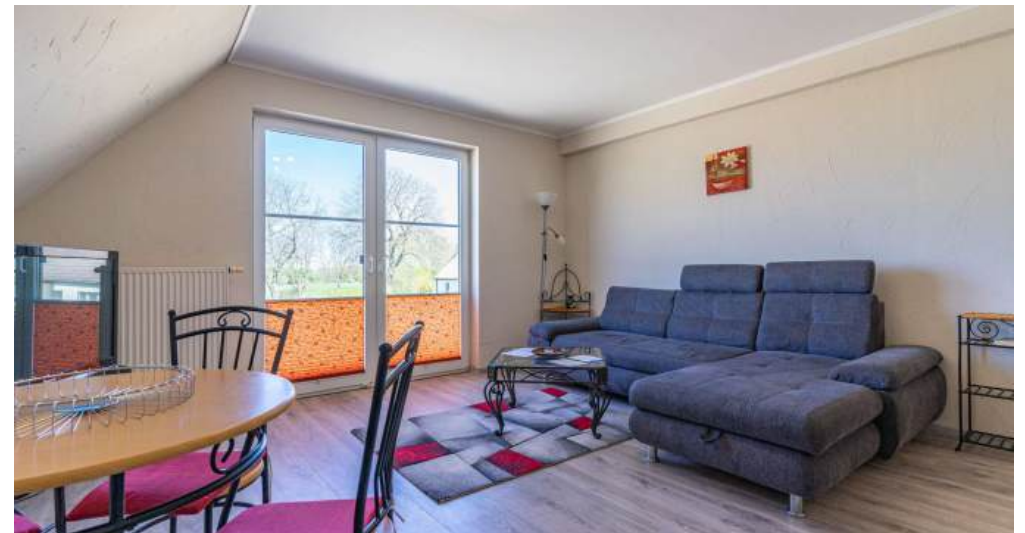
Fewo 3 - Wohnzimmer