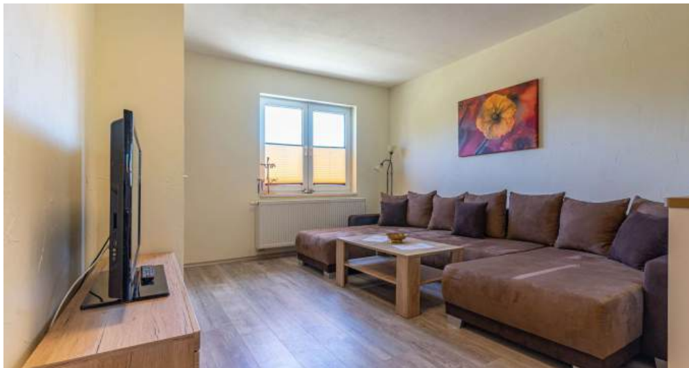
Fewo 5 - Wohnzimmer