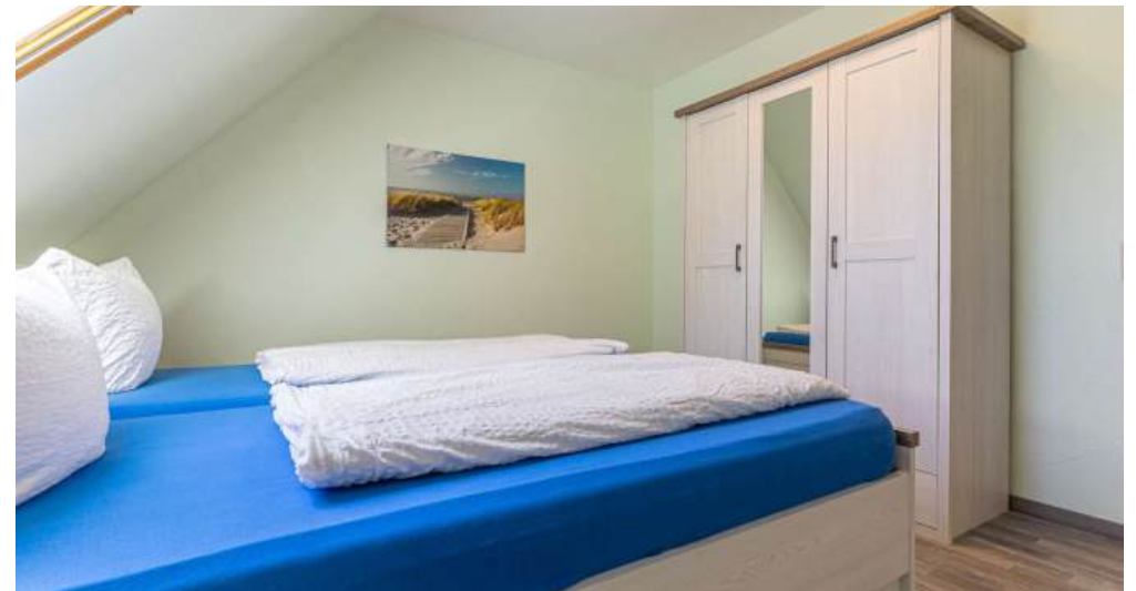
Fewo 4 - Schlafzimmer