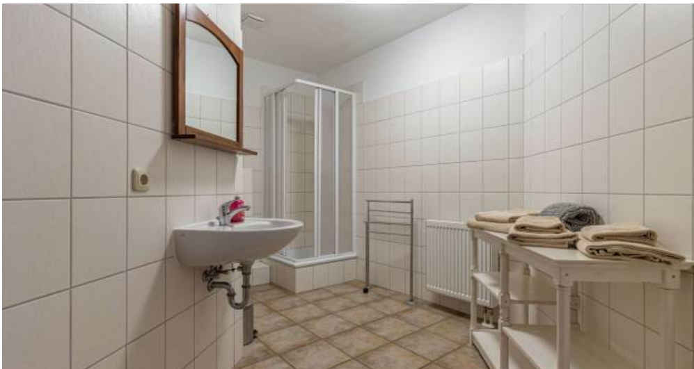
Fewo 5 - Bad