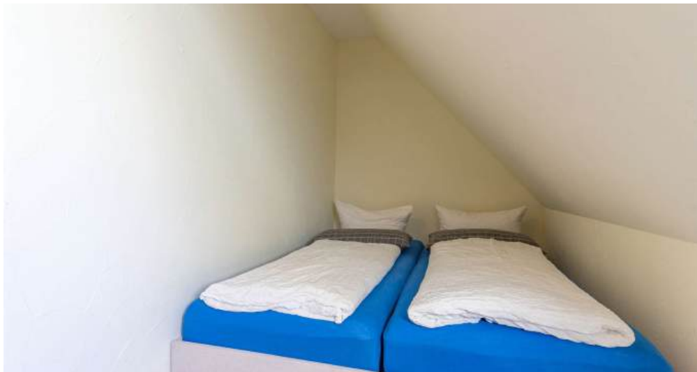
Fewo 5 - Schlafzimmer