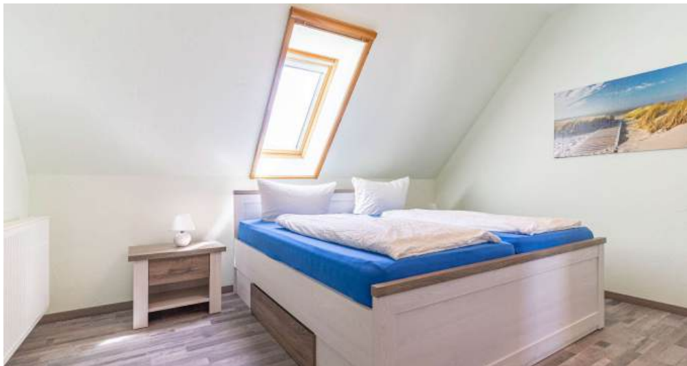
Fewo 4 - Schlafzimmer