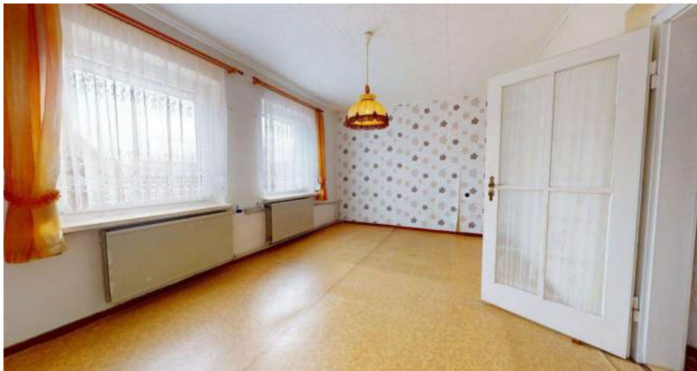
Schlafzimmer - OG