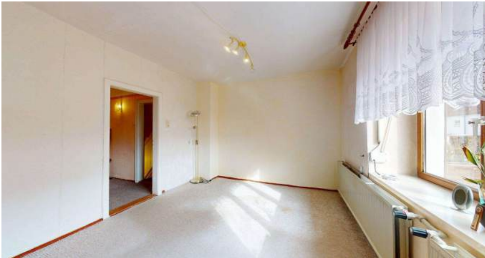
Wohnzimmer - EG