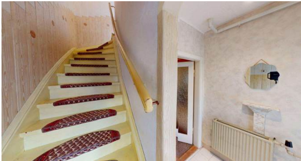
Flur - EG