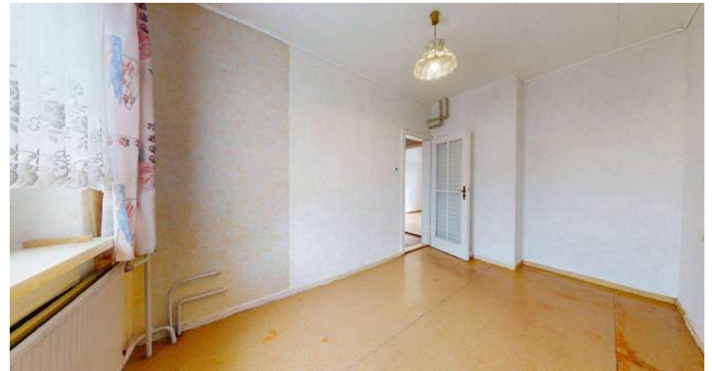
Schlafzimmer - OG