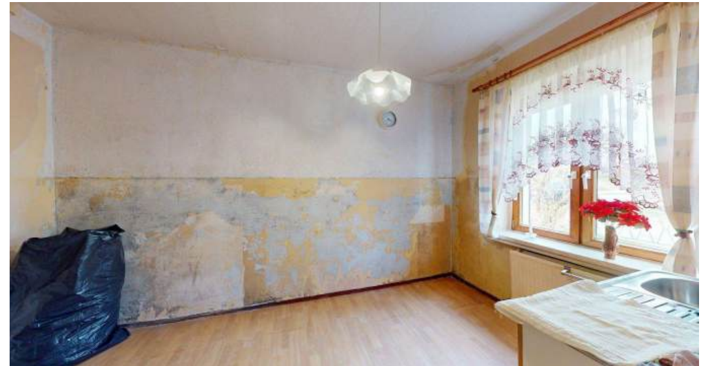
Küche - EG