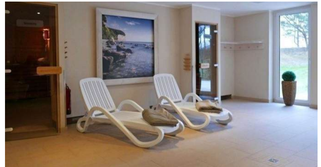
gemeinschaftlicher Wellnessbereich mit Sauna