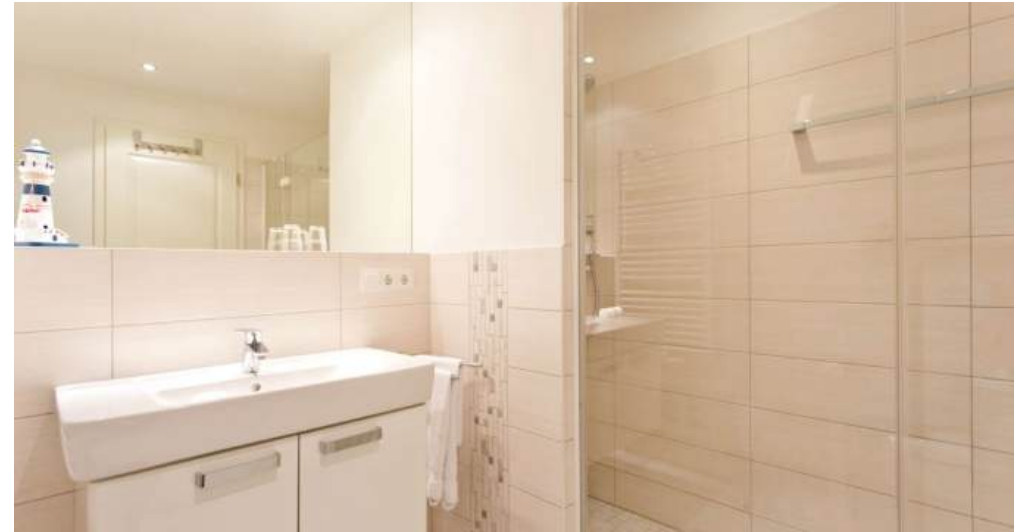
Badezimmer mit bodengleicher Dusche