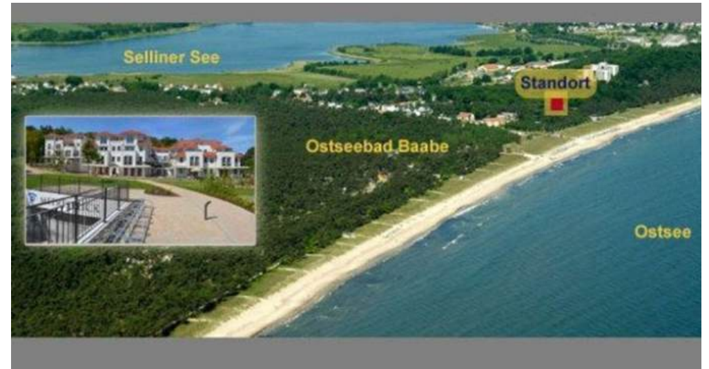
Lage am Badestrand