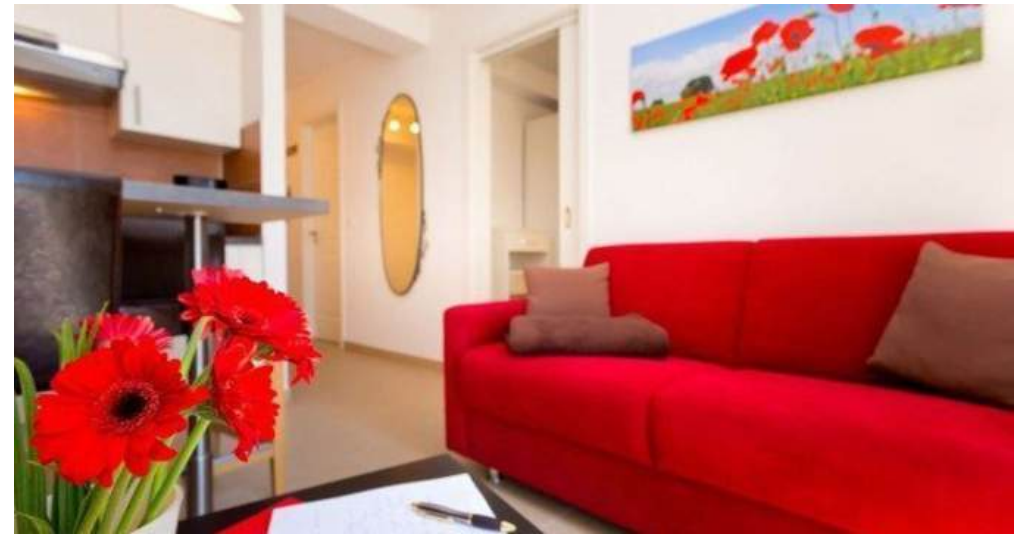
Wohnraum mit gemütlicher Couch