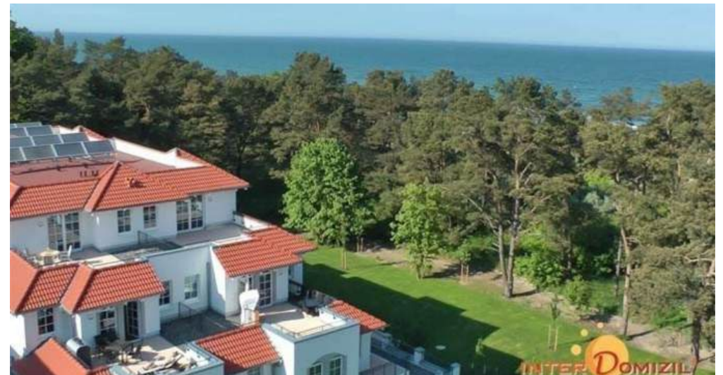
Lage am Strand